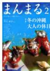
大人の暮らし応援マガジン まんまる 〈毎週第2木曜日発行〉