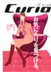
好奇心くすぐる情報誌 Curio(キュリオ) 〈不定期刊〉