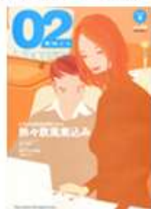
富山の新スタンダード 02(ゼロニイ) 〈毎週第4木曜日発行〉