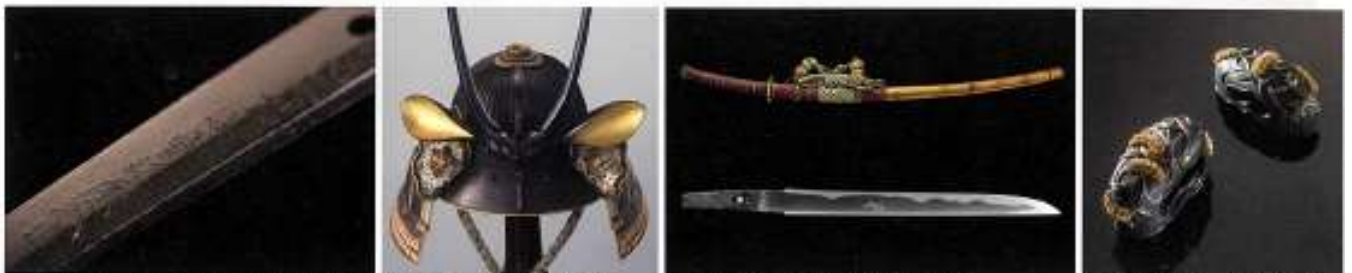
重要文化財 刀 銘 任事藤山忠尚山長藤仲次入道 寛文拾一年二月古存日 数蓮六十二番高札 (上村家伝来) 上：鳥渡刀剣 彦那子地蔵殿唐崎徳高堂太刀拵 下：鳥渡刀剣 兎刀 拵 別種 無形文化財 鎧 一貫奉附 (花序)