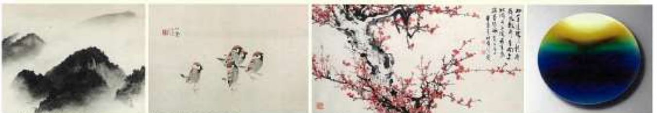
横山大観「雨景」1941 年 竹内栖鳳「西雀」1940 年頃 斎藤平「大紅梅図」 三代 藤田八十吉「れい図」1995 年