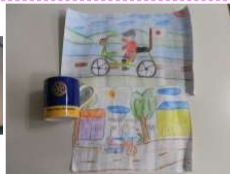
↑メーチャン RC から贈られたマグカップ とタイの子供達が書いた絵