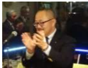
中締めご挨拶 高田会長エレクト