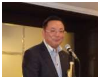
中締めご挨拶 桶屋パスト会長