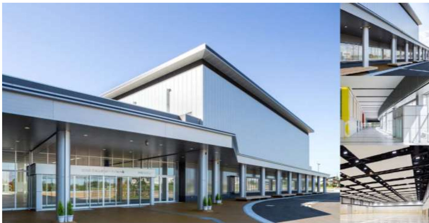
富山県新富町三羽ビル