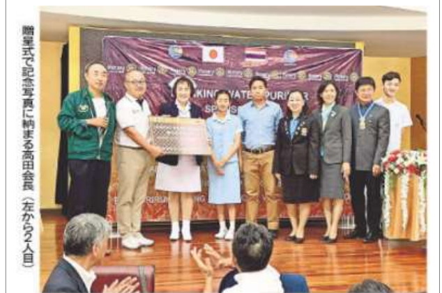
贈呈式で記念写真に納まる高田会長(左から2人目)