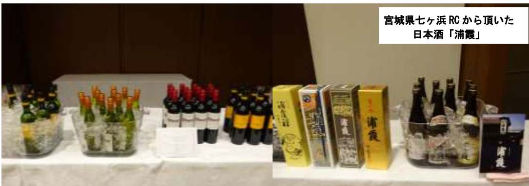
宮城県七ヶ浜 RC から頂いた 日本酒「浦霞」