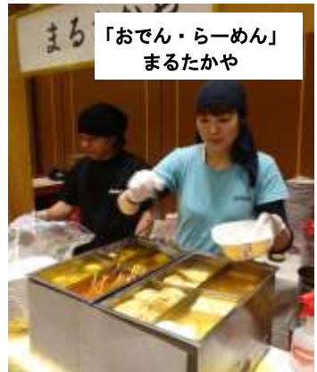
「おでん・らーめん」 まるたかや