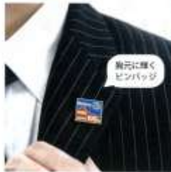
胸元に輝く ピンバッジ