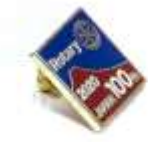
サイズ:20×20mm プレス製作樹脂盛り 高級キャッチ 台紙付き