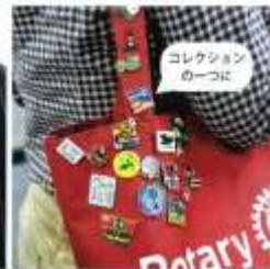
コレクション の一つに