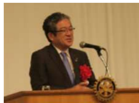
松本ガバナーご挨拶