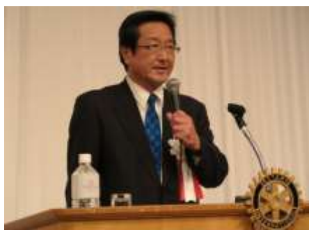
益山ガバナー補佐ご挨拶