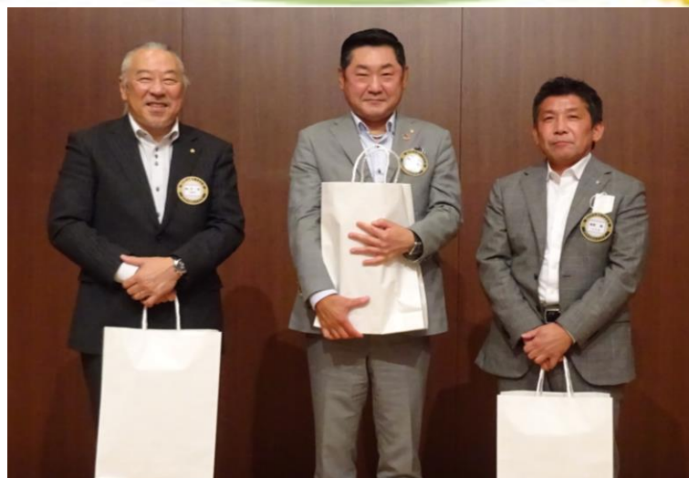
一年間、お疲れさまでございました。