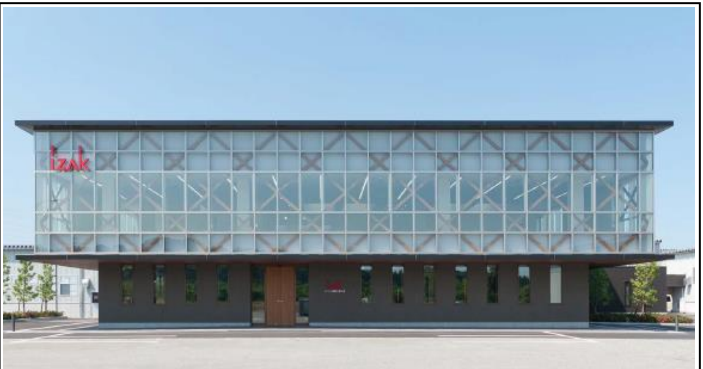
株式会社アイザック パッケージ事業本部