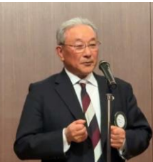
中締めご挨拶 清田パスト会長